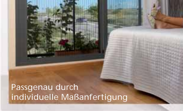
Passgenau durch individuelle Maßanfertigung